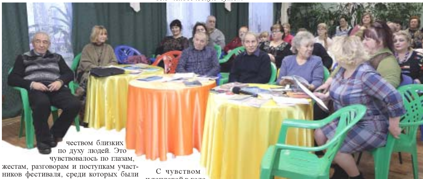
чувством близких по духу людей. Это чувствовалось по глазам,

Особенно полезны такие мероприятия для воспитания подрастающего поколения. Мы видим, как меняется мир людей, как в результате либеральных реформ гаснет интеллект малочитающей молодежи, притупляется ее тяга к истинным человеческим ценностям. Фестиваль поэзии дает возможность зажечь