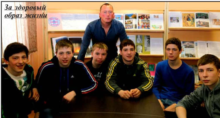
За здоровый образ жизни

Молодые люди имеют четкую гражданскую позицию, не боятся задавать вопросы, с удовольствием анализируют предложенные ситуации и высказывают свое мнение».