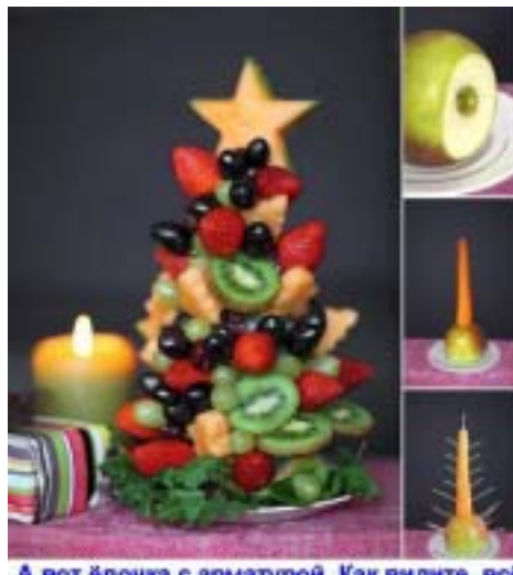
А вот ёлочка с арматурой. Как видите, всё очень просто. Можно такое украшение сделать не только из фруктов, но и из овощей, сыра и колбасы, колченой рыбы.