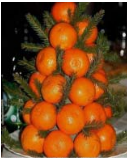
В виде красавицы-елки складываются и мандарины, если их много. Вперемешку с еловыми веточками они украсят гостиную.