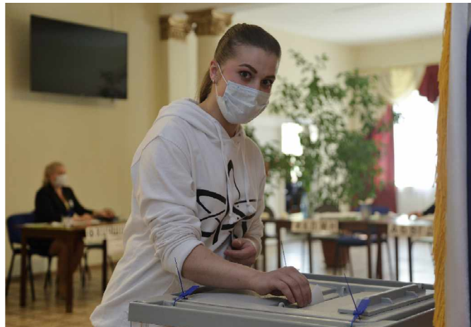
Голосование на избирательном участке № 84 в Ягодном.