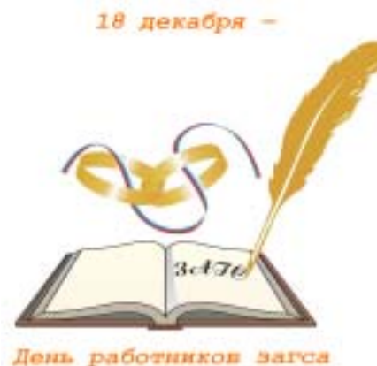
18 декабря - День работников загса

Работников ЗАГС Ягоднинского городского округа не много. Загруженность по обязанностям велика. Главные документы человека должны быть подготовлены точно и своевременно, что