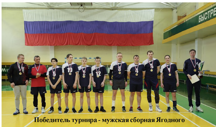
Победитель турнира - мужская сборная Ягодного