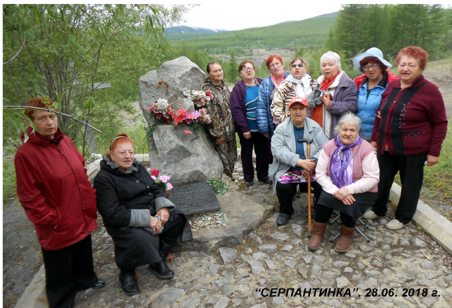
“СЕРПАНТИНКА”. 28.06. 2018 г.