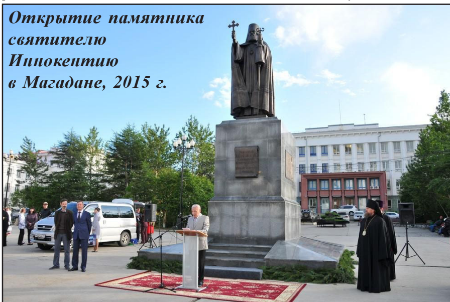
Открытие памятника святителю Иннокентию в Магадане, 2015 г.