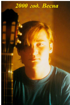
2000 год. Весна

В России, как государственной системе, в настоящее время у нас три уровня управления: федеральный центр, уровень субъектов Российской Федерации, муниципальное или местное самоуправление. Первые два уровня относятся к государственной власти, а третий уровень - особый. В статье 12 Конституции РФ признается и гарантируется местное самоуправление, и органы местного самоуправления не входят в систему органов государственной власти.