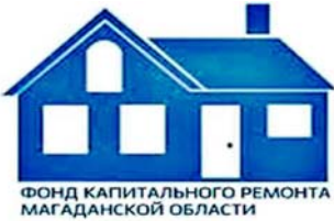
ФОНД КАПИТАЛЬНОГО РЕМОНТА МАГАДАНСКОЙ ОБЛАСТИ