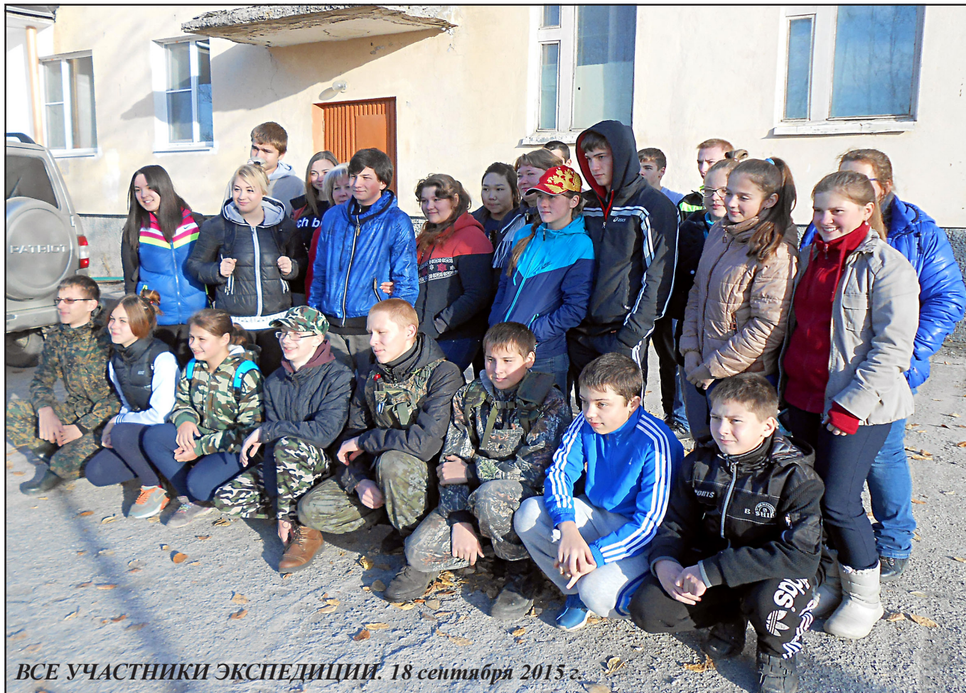
ВСЕ УЧАСТНИКИ ЭКСПЕДИЦИИ. 18 сентября 2015 г.